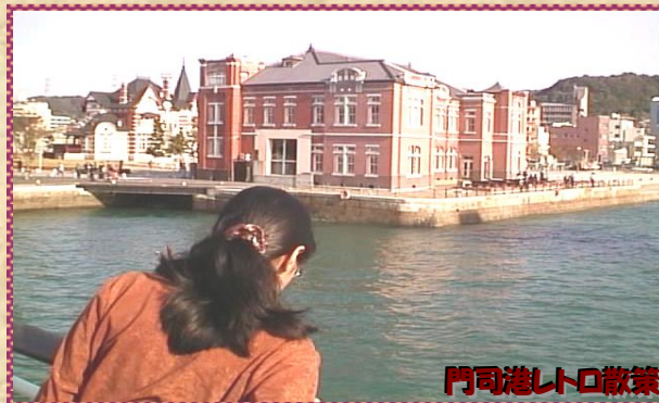
門司港レトロ散策